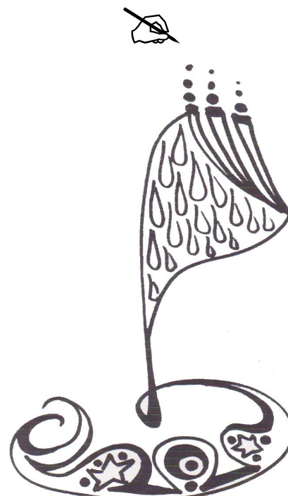
desen de Elena-Liliana Fluture

- Vino cu mine, frate! Aici gândul și fapta sunt una, cum au fost dintru Începuturi.