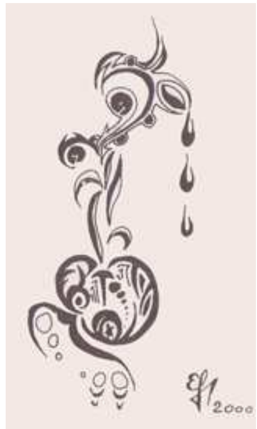
desen de Elena-Liliana Fluture